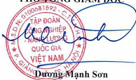
Dương Mạnh Sơn